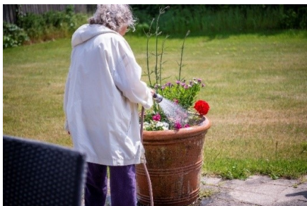
Fra haven omkring Nordhøj